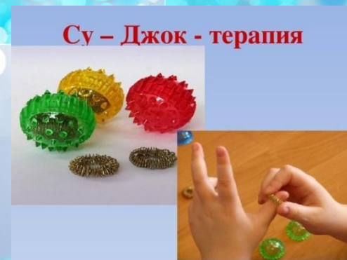
Су – Джок - терапия