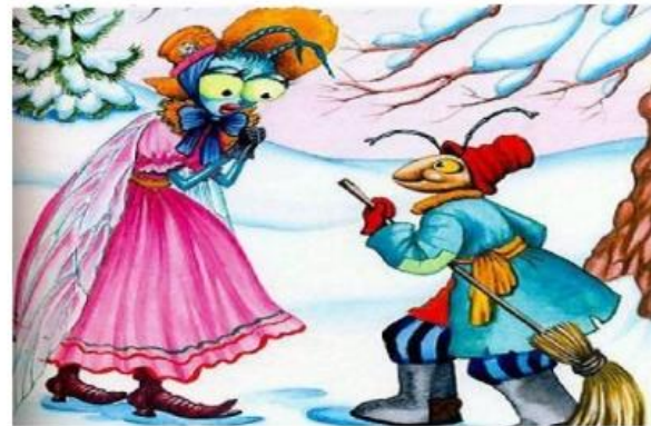
Стрекоза и Муравей.